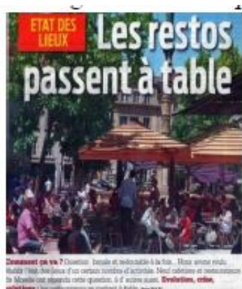
Article de journal 1

Dans certains cas, le sens de l'image matérielle ne reste pas opaque comme dans les publicités 1, 7 et 8, mais il réduit la possibilité d'interprétation sémantique au seul sens littéral de l'EI hébergée par le slogan. Ainsi, le sens phraséologique 'faire des aveux' de l'EI passer à table du slogan Les restos passent à table d'un article de journal gratuit de Moselle (cf. Article de journal 1) n'est non seulement aucunement évoqué par la photo, et en outre neutralisé par une photo de clients d'un restaurant attablés sur une terrasse. La légende de la photo « Comment ça va ? Question banale et redoutable à la fois... Nous avons voulu établir l'état des lieux d'un certain nombre d'activités. Neuf cafetiers et restaurateurs de Moselle ont répondu à cette question, à d'autres aussi. Evolution, crise, solutions : les restaurateurs 31 se mettent à table. » ne peuvent fournir des indices uniquement à ceux qui connaissent le sens 'avoué' de l'EI, le non initié conclura plutôt à un jeu de mots obscur, d'autant plus que l'usage inhabituelle de l'abréviation 'resto' prête à confusion.