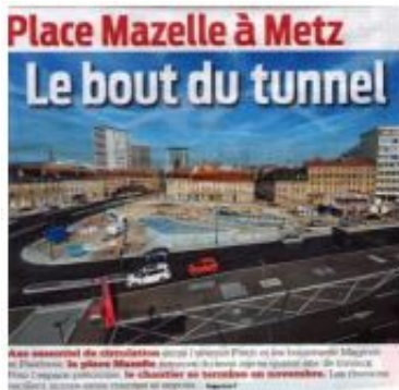
Article de journal 2

Alors que dans les publicités analysées au point 4.4 précédent, au moins un élément du sens littéral de l'EI est encore repris picturalement, un tel rapport n'existe plus du tout dans les publicités présentées ci-après, c'est-à-dire qu'aucun lien apparent existe entre sens littéral de l'EI et image matérielle. Aussi, l'image, une maquette de la future forme de la Place Mazelle à Metz , ne représente d'aucune façon un tunnel (cf. Article de journal 2), et la Publicité 10 ne fait aucun état iconographiques de 'piques'. C'est pour cette raison, bien que les deux EI le bout du tunnel et (s')envoyer des piques soient a priori métaphoriques, qu'il existe tout au plus un lien indirect entre sens métaphorique et image matérielle des deux documents.